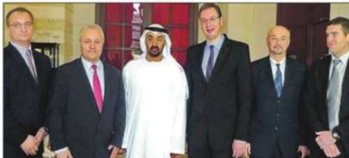
Delegacija Srbije sa šeikom Muhamedom al-Zajedom u Abu Dabiju

- Oni su vrlo dobro platežno društvo i mogu to da plate. Zna- te, 25.000 hektara je relativno